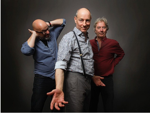
Wieder in Großbeeren: Black Patti