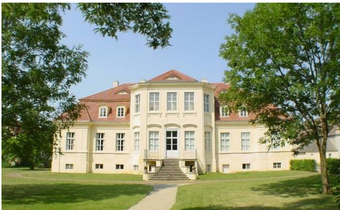
Schloss Reckahn

Es würde uns bei der Planung sehr helfen, wenn uns das Interesse an einer Teilnahme möglichst bald mitgeteilt würde.